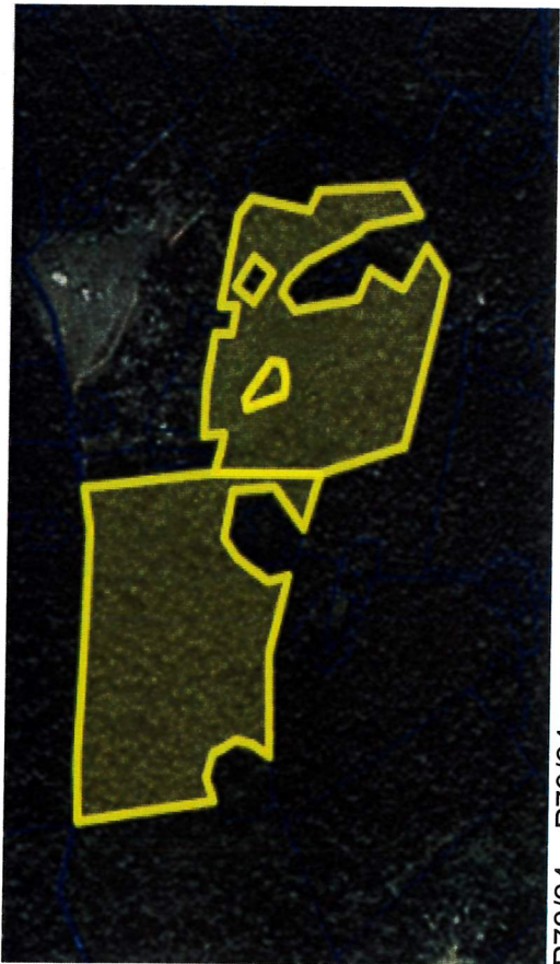
P72/24 - P73/24