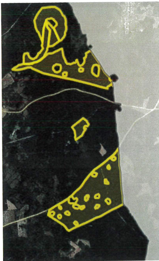
P66/24 - P71/24