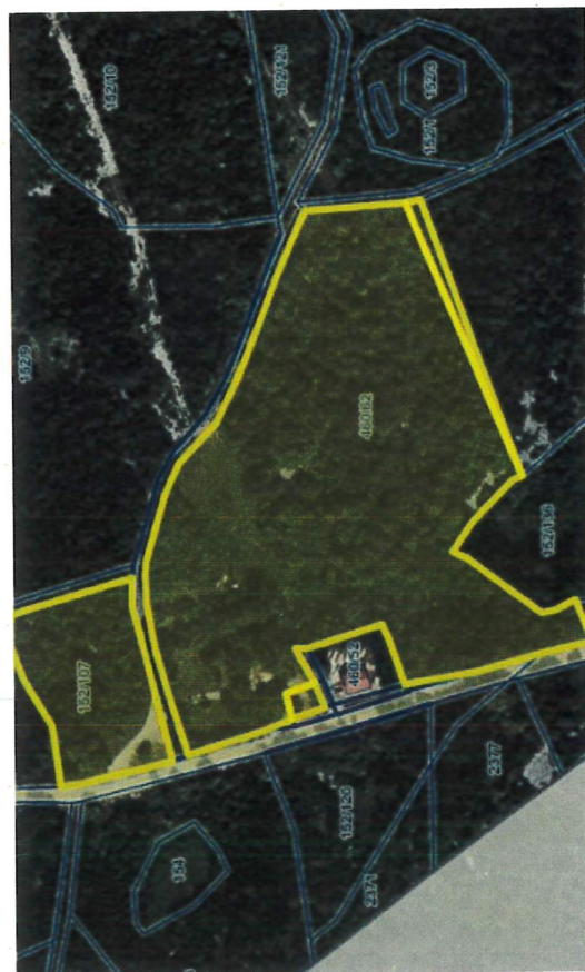
P64/24 - P65/24

P64/24 – P65/24: Nepremičnine v k.o. Brje so stavbna zemljišča na mejnem prehodu Gorjansko. P66/24 – P79/24: Nepremičnine, so gozdna zemljišča, ki jih občina ne potrebuje za delovanje. Nepremičnine bodo prodane v skladu z Zakonom o kmetijskih zemljiščih.