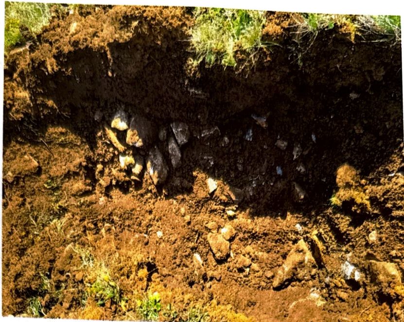
Slika 2: Odrpta brežina v neposredni bližini