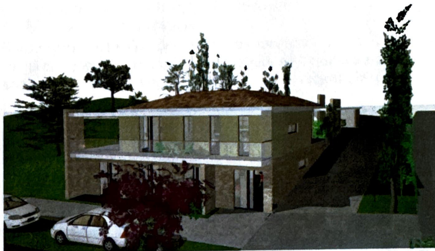
Slika 5: Vizualizacija objekta – pogled z južne strani

Izkop za temeljenje se bo deloma izvajal v zemljini 3.kategorije, pretežno pa v trdi hribini 5. kategorije.