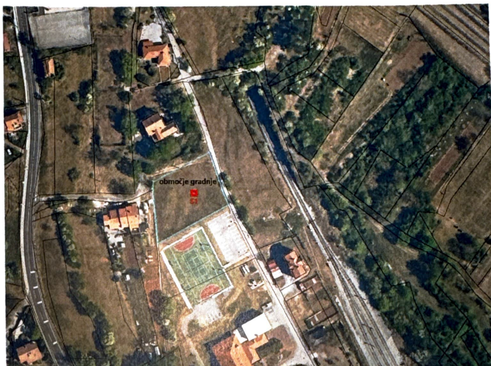
Slika 1: Ortofoto prikaz območja gradnje

Na lokaciji gradnje je bil izveden sondažni razkop.