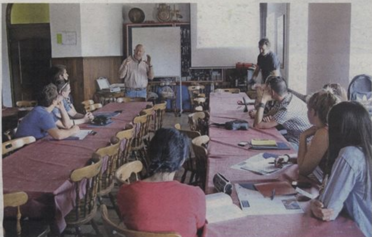
17-dnevna šola se je včeraj pričela s predavanjem dr. Jožeta Pirjevca

KOMEN ▶ 19 študentov različnih smeri iz primorske in reške univerze bo sedem-najst dni na predavanjih in delavnicah spoznavalo Soško fronto na Krasu.