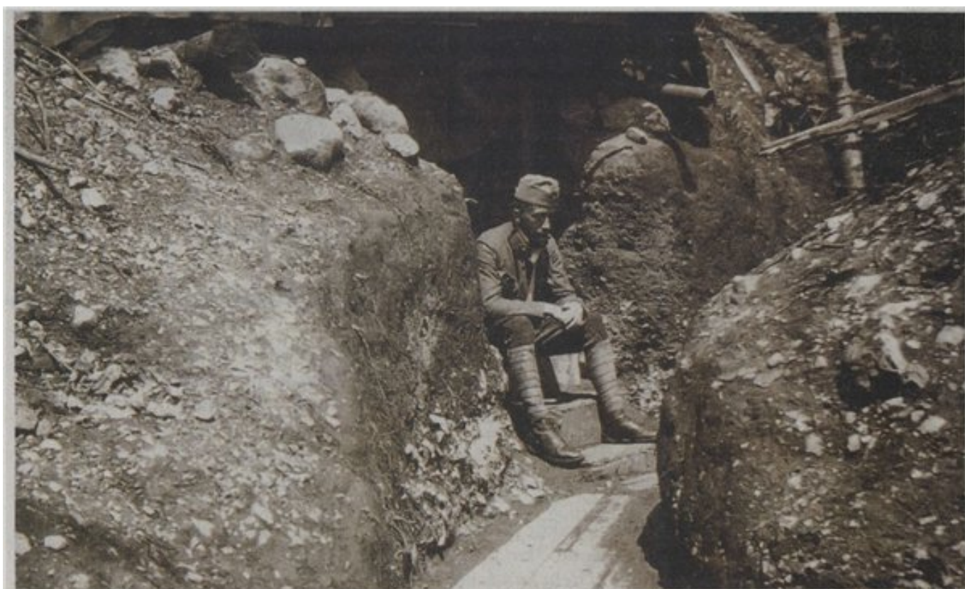
Prva svetovna vojna je prinesla morijo, kakršne svet dotlej še ni videl, stoletje kasneje pa zgodovinske dogodke lahko izkoristimo za promocijo svojega kulturnega premoženja, ocenjujejo poznavalci