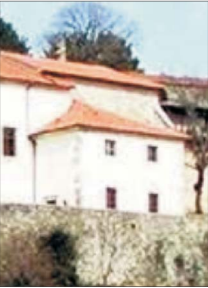
PRIKAZ FASAD - JUŽNI POGLED NA NIZ 2 - LIST 3